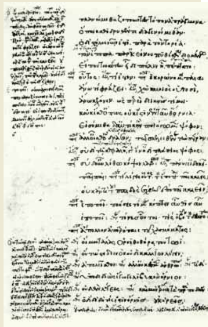
Cod. Est. a U 5. 10 (E) f. 171v Ar. Av. 44–67 mit Scholien und Glossen. In: „D. Holwerda (ed.), Scholia in Aristophanem II,3: Scholia vetera et recentiora in Aristophanis Aves, Groningen 1991.“