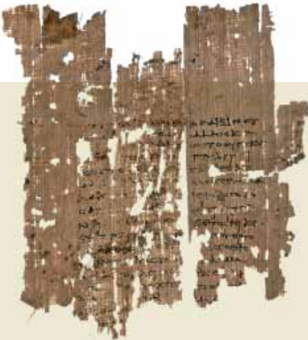
P.Oxy. XXXV 2738, In: E. Lobel, Commentary on an Old Comedy , 1968.

www.komfrag.uni-freiburg.de/baende_liste