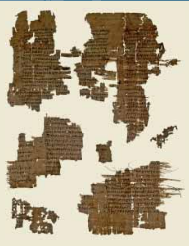
Papyrus, Kommentar zu dem Marikas von Eupolis (Fragment), POxy 2741.