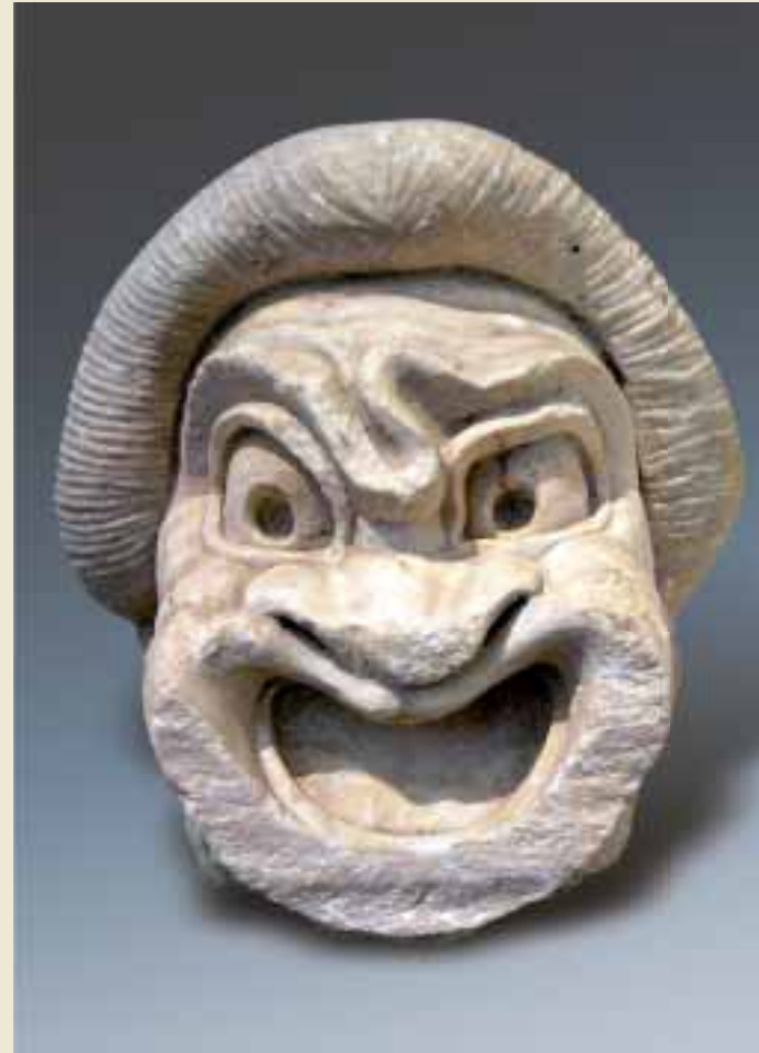
Theater-Maske, Typ des „Ersten Sklaven“ aus der Neuen (griechischen) Komödie, pentelischer Marmor, 2. Jahrhundert v. Chr. Archäologisches Nationalmuseum Athen.

Die Gesamtzahl der erhaltenen Komödienfragmente der 253 namentlich bekannten Dichter beläuft sich auf 8501. Dazu kommt eine große Zahl von Testimonien, Zeugnissen zu Leben und Werk der Dichter. Aus dem 5. Jahrhundert v. Chr. ist die größte Zahl von Fragmenten von der komischen Trias, Kratinos (594 Fragmente), Aristophanes (976) und Eupolis (494), erhalten, dazu kommen weitere, relativ gut bezeugte Autoren wie Pherekrates (288) und Theopomp (108) oder Hermippos (94). Aus dem 4. Jahrhundert sind Antiphanes (327) und Alexis (342) durch eine große Zahl von Fragmenten belegt. Aus hellenistischer Zeit (Ende 4. Jh.–1. Jh. v. Chr.) ist Menander natürlich in erster Linie durch die Papyrusfunde seit dem Ende des 19. Jahrhunderts, aber auch durch zahlreiche Fragmente (1001) gut bezeugt. Aus dieser Phase ist jedoch auch von Philemon (198) oder Diphilos (137) eine stattliche Zahl von Bruchstücken erhalten. Sehr umfangreich ist die Gruppe der nicht einem bestimmten Autor zugewiesenen Fragmente, der Adespota (1155), die aufgrund der mit ihnen verbundenen methodischen Schwierigkeiten kaum erforscht sind.