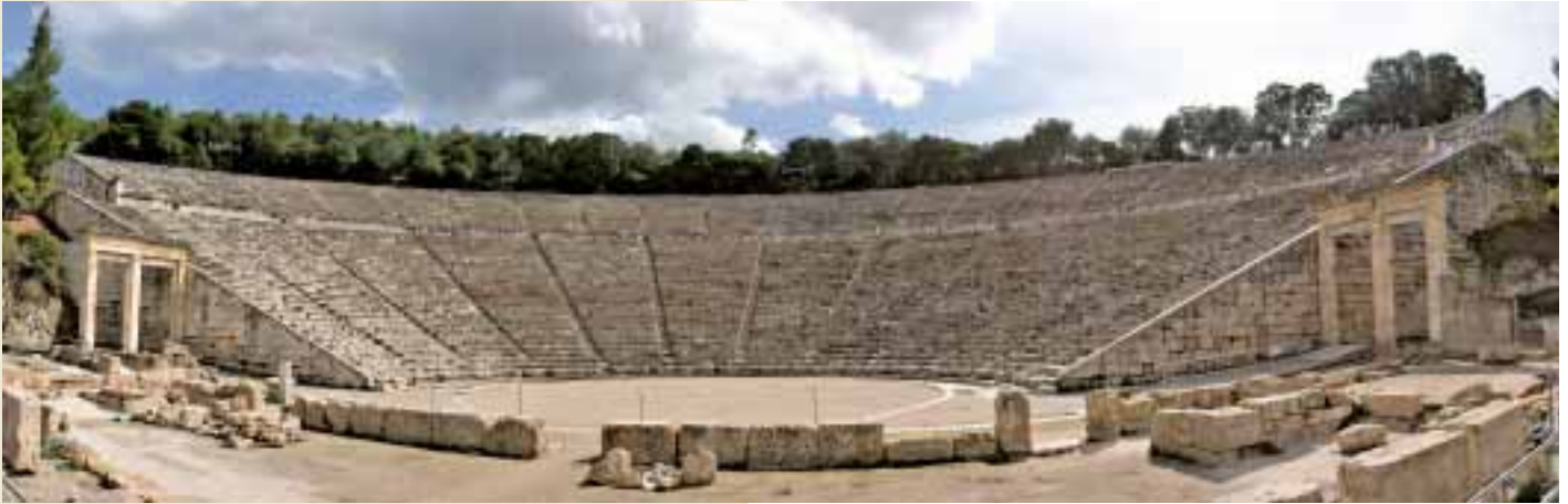
Theater von Epidauros, Foto: Andreas Trepte.